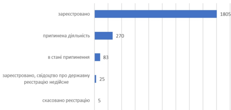
Поточний стан органів самоорганізації населення 2021 рік

Найбільша кількість ОСН, що припинили діяльність або ж перебувають у стані її припинення, зафіксована у Криму ( 45 ), Івано-Франківській ( 32 ), Дніпропетровській ( 31 ), Волинській ( 28 ) та Вінницькій областях ( 26 ).