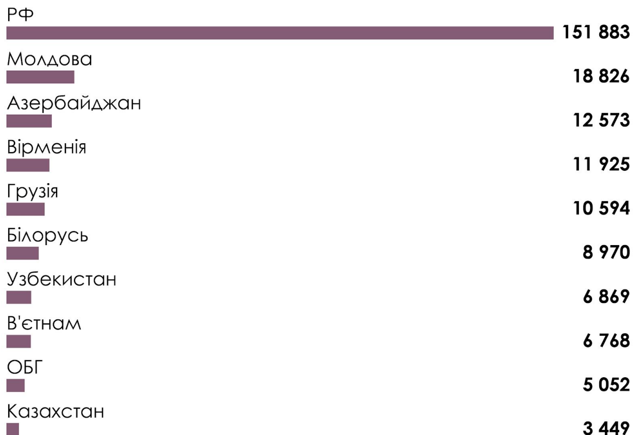
Рис. 2. Основні країни походження іноземців/-ок, які постійно проживають в Україні, станом на 1 січня 2019 року