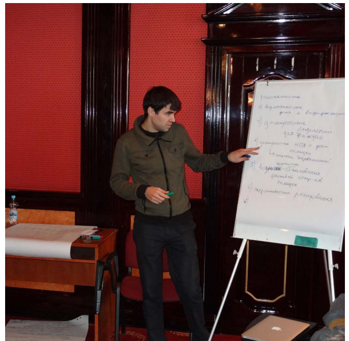
Міжнародний семінар "Розвиток громадського контролю за правоохоронними органами в регіоні ОБСЄ".