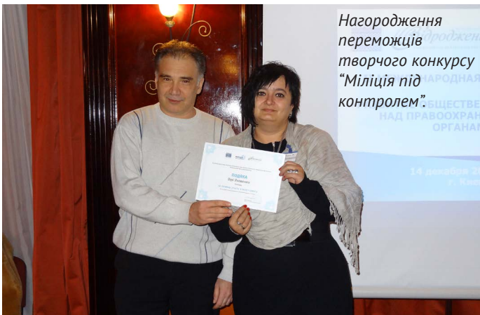
Нагородження переможців творчого конкурсу «Міліція під контролем».