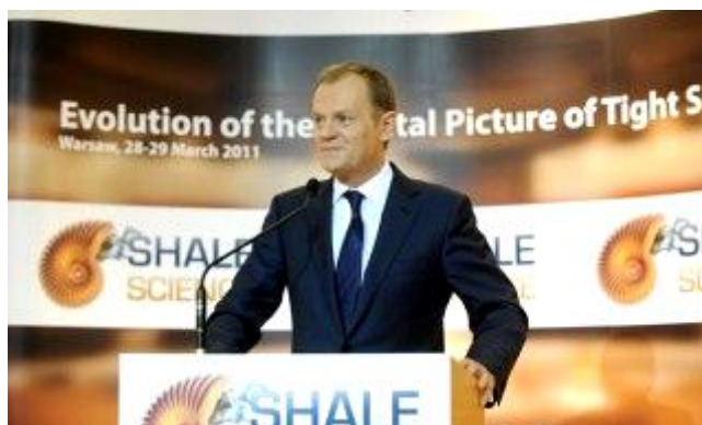
Прем'єр-міністр Польщі Дональд Туск

Нинішня правляча партія на чолі з прем'єр-міністром Д.Туском під час виборів 2012 року використала тему видобутку сланцевого газу під час кампанії – пообіцявши створити спеціальний фонд для відрахувань від діяльності з видобутку нетрадиційного газу, який буде використовуватись для виплати пенсій у майбутньому. На думку експертів, успіхи уряду в залученні інвесторів і бурхливій діяльності в сфері видобутку стануть одним із аргументів, що сприятимуть повторному обранню уряду Д.Туска в майбутньому 13 .