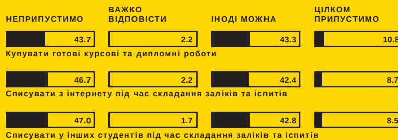
ПРИПУСТИМІСТЬ ВИДІВ АКАДЕМІЧНОЇ НЕДОБРОЧЕСНОСТІ ДЛЯ СТУДЕНТІВ, %

Студенти при виконанні письмових навчальних робіт часто вдаються до таких порушень академічної доброчесності, як списування, плагіат, придбання робіт, виконаних на замовлення. 76% студентів залучені до нечесних колективних практик при складанні іспитів, 47% — послуговуються шпаргалками, більше 90% — вчиняє плагіат у тій чи іншій формі. 1 Плагіат зустрічається в дисертаціях на здобуття наукового ступеня кандидата (доктора) наук: близько «50% дисертацій не відповідають мінімальним стандартам академічної якості, містять плагіат, або ж і те, й інше».