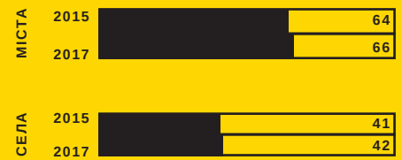
ОХОПЛЕННЯ ДІТЕЙ ДОШКІЛЬНОЮ ОСВІТОЮ, %

Нестача місць у комунальних закладах дошкільної освіти і високий попит на їх послуги призводять до недоброчесних процедур вступу до дитсадків.